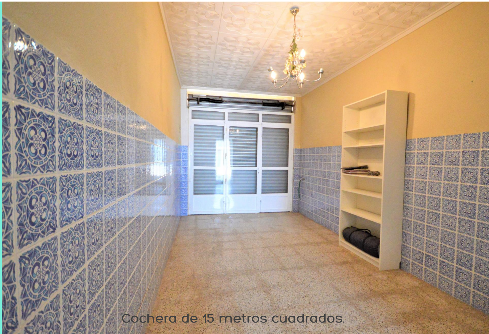
Cochera de 15 metros cuadrados.