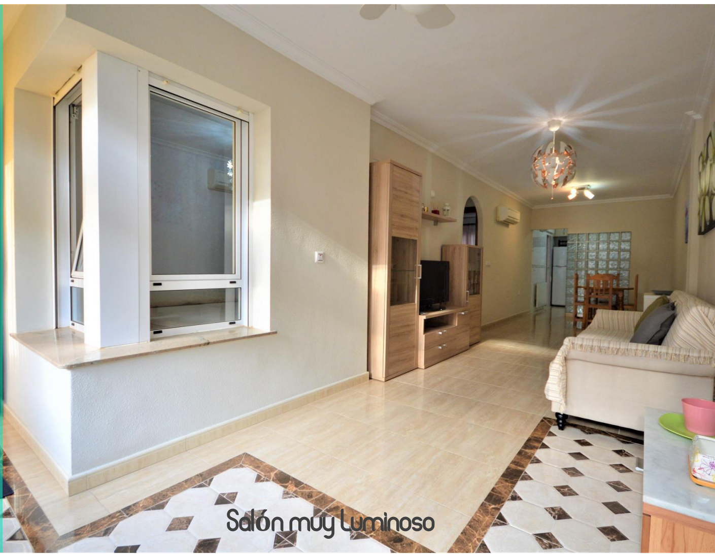
Salón muy luminoso