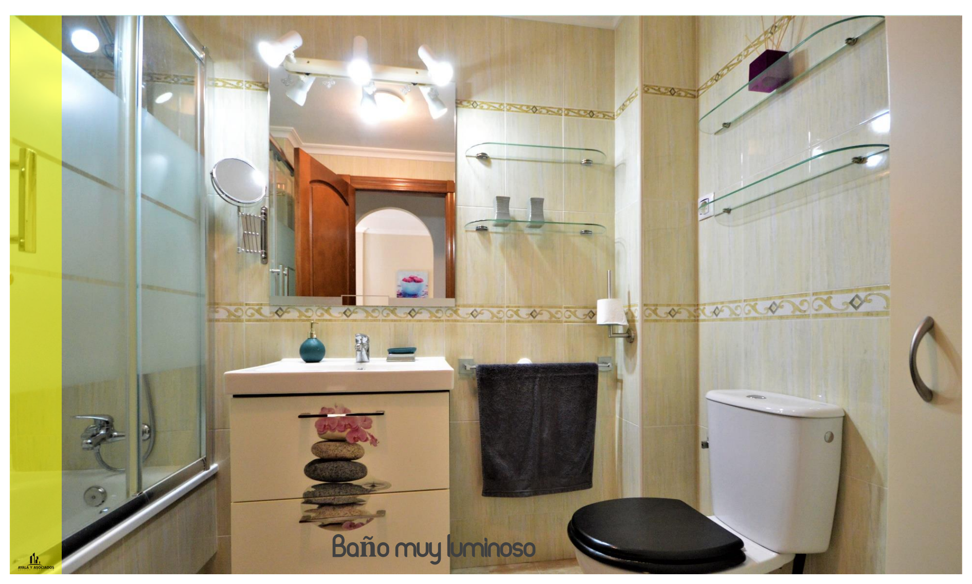
Baño muy luminoso